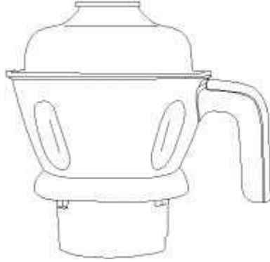
مطحنة صغيرة 1.0 لتر